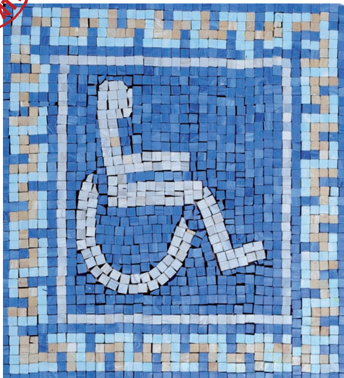
œuvre originale d'Arno Marvillet

8h - 18h à l'UNESCO Paris - Salle II 7, place de Fontenoy - 75352 Paris 07